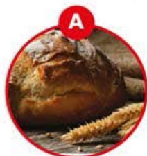
A FÜR GLUTENHALTIGES GETREIDE UND DARAUS GEWONNENE ERZEUGNISSE

Über Zutaten in unseren Gerichten, die Allergien oder Intoleranzen auslösen können, informieren Sie unsere Mitarbeitenden auf Anfrage gerne.