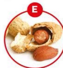
E FÜR ERDNÜSSE UND DARAUS GEWONNENE ERZEUGNISSE

Kräcker, Soßen, Suppen, Würzpasteten, Würste, Surimi, Sardellenwurst, Brotaufstriche, Feinkostsalate, Pasteten, Vitello tonnato