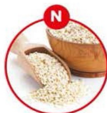
N FÜR SESAMSAMEN UND DARAUS GEWONNENE ERZEUGNISSE

Fleischerzeugnisse, Feinkostsalate, Suppen, Soßen, Dressings, Mayonnaise, Ketchup, eingelegetes Gemüse und Gewürzmischungen, Käse, Essiggurken