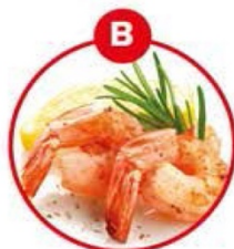
B FÜR KREBSTIERE- UND DARAUS GEWONNENE ERZEUGNISSE

Brot und Gebäck, Kuchen, Teigwaren, Suppen, Soßen, Paniermehl, Semmelbrösel, Wurstwaren, Backerbsen, Frischkornbreie, Desserts, Schokolade