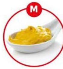
M FÜR SENF UND DARAUS GEWONNENE ERZEUGNISSE

Suppengrün, Gewürzbrot, Wurst, Fleischerzeugnisse, Fleischzubereitungen, Kräuterkäse, Fertiggerichte, Feinkostsalate, Brühe, Suppen, Eintopf, Marinaden, Gewürzmischungen, Curry, salzige Snacks (Chips)