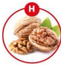
H FÜR SCHALENFRÜCHTE UND DARAUS GEWONNENE ERZEUGNISSE

Brot, Kuchen, Gebäck, Brüh-, Koch-, Roh-, Bratwurst, Feinkostsalate, Margarine, Nussnougatcreme, Müsli, Schokolade, Karamell, Aufläufe, Pommes Frites, Chips, Suppen, Soßen, Dressings, Marinaden, Desserts, Kakao, Wein