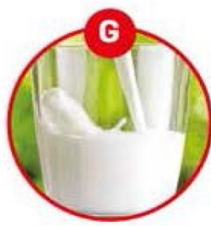
G FÜR MILCH VON SÄUGETIEREN UND MILCHERZEUGNISSE (INKLUSIVE LAKTOSE)

Brot, Kuchen, Gebäck, Feinkostsalate, Margarine, Schokocreme, Brotaufstriche, Müsli, Schokolade, Kekse, Kaugummi, Soßen, Dressings, Marinaden, Mayonnaise, Eis, Sportlernahrung, Diät drinks, Kaffeeweiß