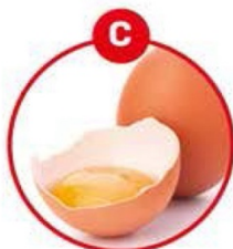
C FÜR EIER VON GEFLÜGEL UND DARAUS GEWONNENE ERZEUGNISSE

Feinkostsalate, Suppen, Soßen, Paella, Bouillabaisse, Sashimi, Surimi