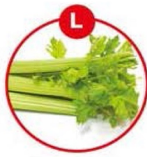
L FÜR SELLERIE UND DARAUS GEWONNENE ERZEUGNISSE

Brot, Kuchen, Gebäck, Brühwürste, (Pistazien), Rohwürste (Walnüsse), Pasteten, Feinkostsalate (Waldorf), Joghurt, Käse, Juss-/Nougatcreme, vegetarische Aufstriche, Müsli, Schokolade, Marzipan, Müsliriegel, Kekse, Dressings, Curry, Pesto, Desserts, Likör, aromatisierter Kaffee