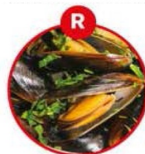
R FÜR WEICHTIERE WIE SCHNECKEN, MUSCHELN, TINTENFISCHE UND DARAUS GEWONNENE ERZEUGNISSE

Brot, Gebäck, Pizza, Nudeln, Snacks, fettreduzierte Fleischerzeugnisse, Fleischersatz/vegetarische Produkte, Desserts, milchfreier Eiersatz, Kaffeeersatz, Flüssiggewürze