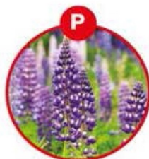
P FÜR LUPINEN UND DARAUS GEWONNENE ERZEUGNISSE

Fruchtzubereitung, Müsli, Brot, Fleischerzeugnisse und -zubereitungen, Feinkostsalate, Suppen, Soßen, Sauerkraut, Fruchtsaft, Chips und andere getrocknete Kartoffelerzeugnisse, gesalzener Trockenfisch