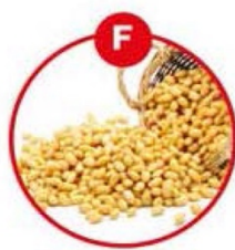
F FÜR SOJA (-BOHNEN) UND DARAUS GEWONNENE ERZEUGNISSE

Margarine, Brot, Kuchen, Gebäck, Schokocreme, Brotaufstriche, Cereallen, Müsli, Frühstücksflocken, Schokolade, Feinkostsalate, Marinaden, Satésauße, Eis, aromatisierter Kaffee, Likör, (Pommes Frites)