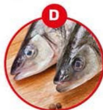
D FÜR FISCH UND DARAUS GEWONNENE ERZEUGNISSE (AUSSER FISCHGELATINE)

Eierteigwaren, panierte Speisen, Mayonnaise, Palatschinken, Kuchen, Gebäck, Brot, Nudeln, Croutons, Faschierter Braten, Burger, Feinkostsalate, Pasteten, Quiches, Soßen, Dressings, Desserts