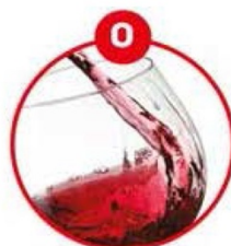
O FÜR SCHWEFELDIOXID UND SULFITE

Brot, Knäckebrot, Gebäck (süß und salzig), Müsli, vegetarische Gerichte, Falafel, Salate, Humus, Feinkostsalate, Marinaden, Desserts